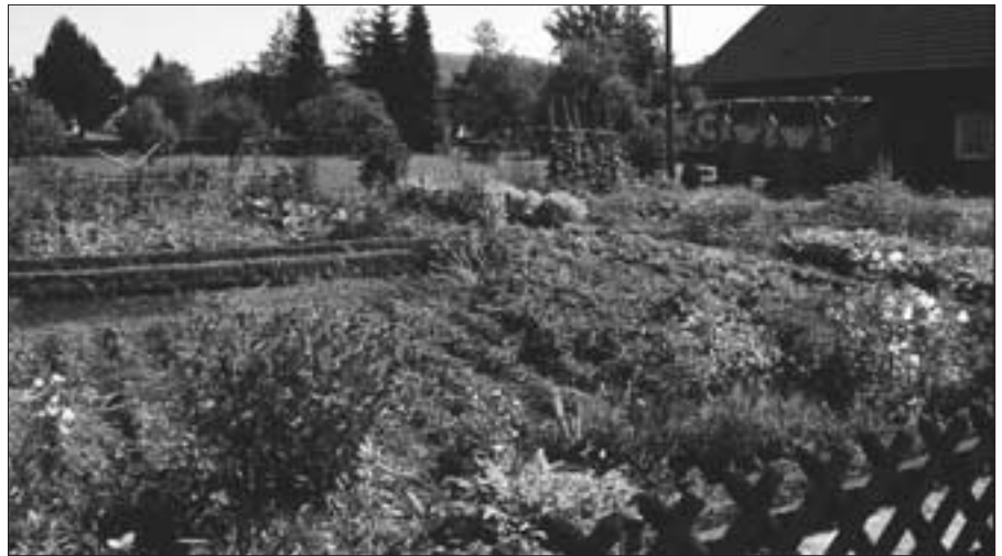
Bauerngarten in Littfeld

Mit solchen oder ähnlichen Erwartungen waren im Juli und August Gartenfreunde der Ankündigung des Heimatvereins sowie des Obst- und Gartenbauvereins Burbach gefolgt, um auf einer Führung der Biologische Station Rothaargebirge im alten Burbach Dorfpflanzen und schöne Bauerngärten zu suchen, vor allem aber, um deren vielfältige Pflanzenwelt kennen zu lernen. Schon die ersten Meter oberhalb der alten Vogtei kamen einer Wildrosenwanderung gleich: da wuchsen die kahlblättrige Hundsrose, die nach Apfelester duftende drüsige Weinrose, behaarte Filzrose, Kartoffelrose (sehr dicke Hagebutten) und die Rotblättrige Rose. Der Rundweg führte dann durch den Gassenweg und Lohbau-Weg um den Kirchberg zur Nassauischen Straße und anschließend zum Römer. Üppige Farben- und Formenvielfalt und eine Vielzahl erst in den letzten 10-20 Jahren in die Gärten eingebrachter, attraktiver Stauden, Sträucher und Bäume zeichnete die meisten hochsommerlichen Gärten aus. In alten Bauerngärten jedoch, hatte die Nützlichkeit absoluten Vorrang vor der Schönheit. Der Bauerngarten hatte einen wesentlichen Teil zur Selbstversorgung beizusteuern. Diesem Beitrag entspricht der Pflanzenbestand in alten Bauerngärten. Sie hatten für Mensch