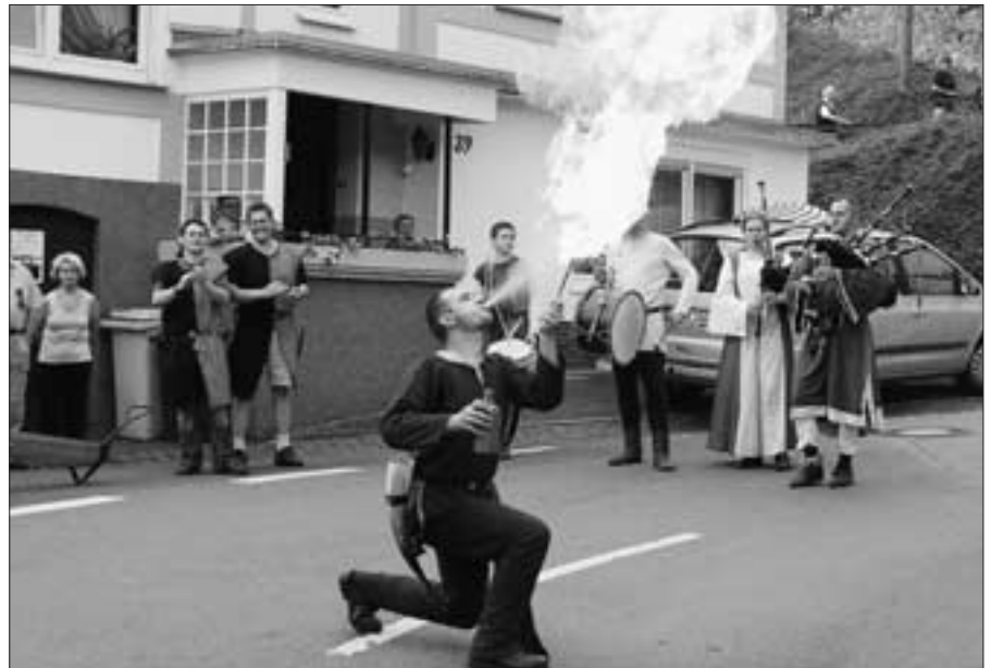
Ein mittelalterliches Dorfgelage mit Feuerschlucker

Es folgte am 14. Juni ein Friedrich-Kiel-Konzert mit dem Bamberger Streichquartett. Ein gelungener Auftakt für das Dorfjubiläum. Rund 150 Zuhörer kamen in die alte Wehrkirche, um dem Streich-