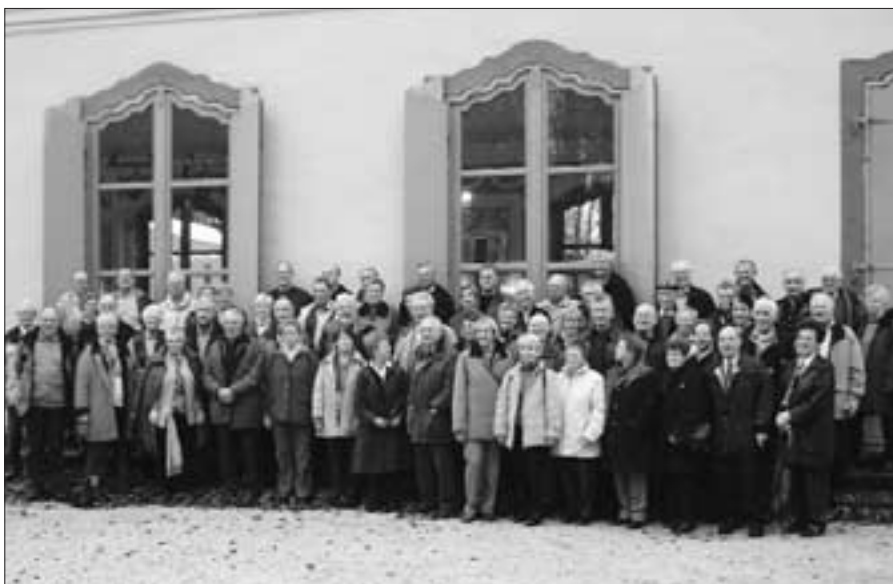
Die Gruppe vor der Konzertgalerie

weihnachtszeit auch am Samstag und Sonntag, dem 13. und 14. Dezember mit Kaffee, Plätzchenverkauf und Ausstellung nachgeholt werden.