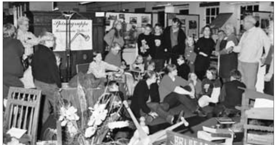
Besuch der Heimatstube des Heimatvereins Vlotho

Mit Unterstützung der pädagogischen Mitarbeiter des Jugendhofs Vlotho und der Westfälischen Arbeitsgemeinschaft Bild + Form Ostwestfalen-Lippe erarbeiteten die Kinder in einem zweitägigen Seminar eine Ausstellung mit unterschiedlichen Aspekten zu den Themen „Kinderzimmer, Schatzinsel, Weltreise und Erinnerung“. Die Themen sowie die Zusammenstellung der Bereiche ergaben sich aus den von den Kindern mitgebrachten Lieblingsobjekten. So sah man