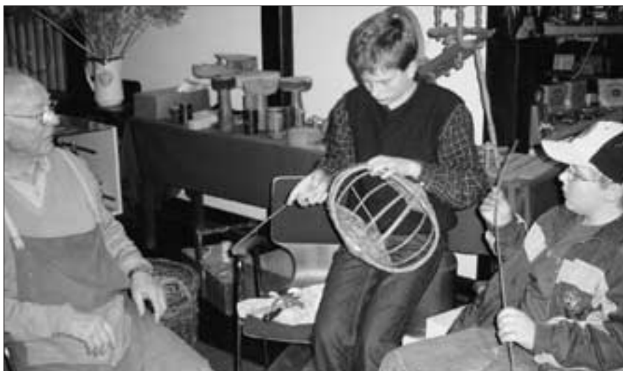
Der Korb konnte aus Zeitmangel leider nicht fertiggestellt werden

Vorstellung der Schatzinsel der neunjährigen Museumsmacher