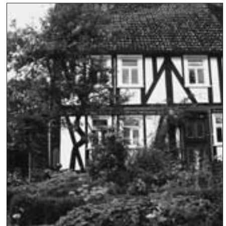
Bauernhaus in Holzhausen

Ein Großteil der Nutzgartenpflanzen hat schon in sehr früher Zeit Zugang in die Bauerngärten gefunden. Zahlreiche Pflanzen, die bereits Karl der Große (764-814) in seinen Landgütern kultivieren ließ, nahmen den Weg über mittelalterliche Klöster (s. Aufzeichnung von Hildegard von Bingen, u.a.) in den bürgerlichen Gärten. Manches Kraut, was zur Selbstversorgung früher nützlich war, wurde aber erst viel später zur attraktiven Zierpflanze, v.a. die alten Heilpflanzen Garten-Eisenhut, Roter Fingerhut, Deutscher Alant, Lungenkraut, Christ- und Pfingstrose oder die Königskerzen.