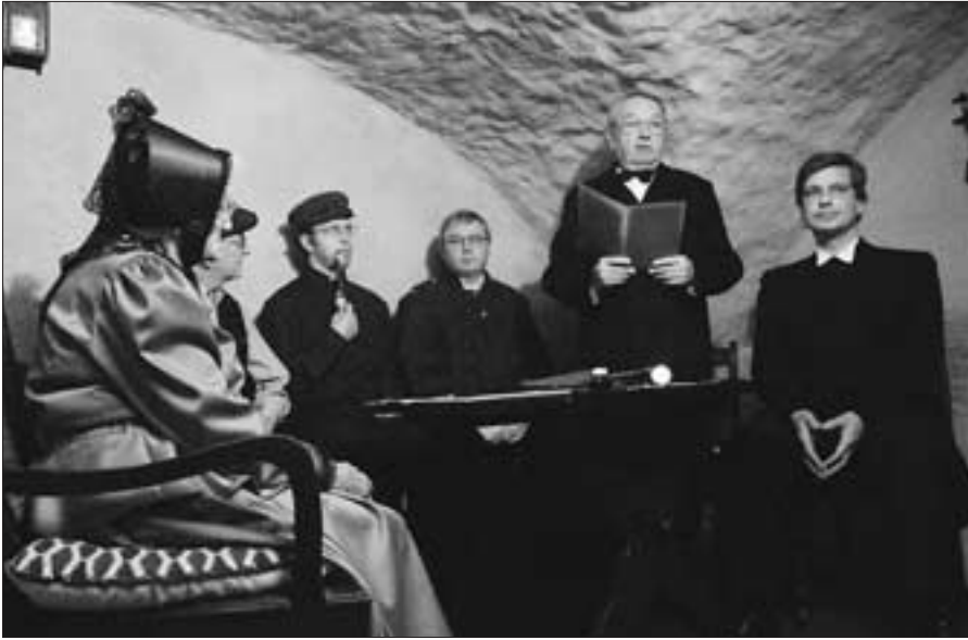
Szene aus dem Spielstück „Das Stift ging stiften“