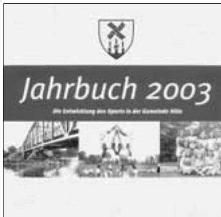
Eine sportliche Gemeinde stellt sich vor.

derts bis in die heutige Zeit. Die Schilderungen von Heiterem und Historischem werden durch zahlreiche Photos illustriert und sprechen nicht nur ehemalige und noch aktive Sportler an.