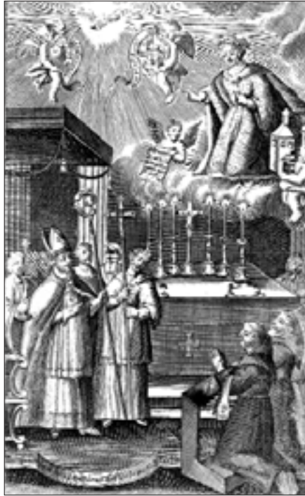
Marienfrömmigkeit: Verehrung Mariens als geistliche Braut

Aus diesem Fundus werden mit der Ausstellung „Frömmigkeit und Wissen“ in einer Auswahl 46 besonders schöne und seltene Exponate aus allen Teilgebieten der Theologie, Kultur- und Ordensgeschichte einer breiteren Öffentlichkeit