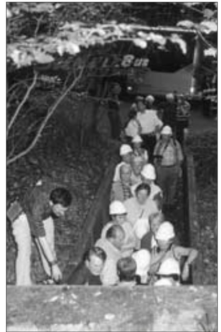
Einfahrt in einen Trinkwasserstollen

wenn der Absender nicht sofort eine Antwort erhält.“ Die Anregungen werden gesammelt, mit Fachleuten auf Umsetzbarkeit überprüft. In gewissen Abständen folgt darauf ein Auftrag an die eingesetzte Agentur, damit die Kosten auch in einem überschaubaren Rahmen bleiben.