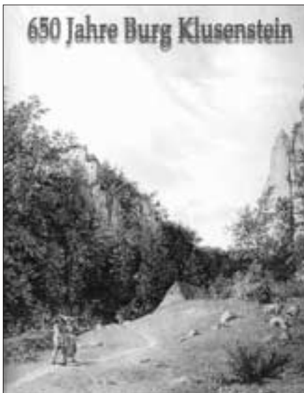
Burg Klusenstein und die Mühle

schungen von Theo Bönemann und Bernd Kirschbaum (insbesondere S. 7-27 und 50-79) über die Ersterwähnung der märkischen Burg im Jahre 1353, ihre Geschichte, die Ausgestaltung und die Bedeutung der Klusensteiner Mühle. Die der Burg ihren Namen „Klusenstein“ gebende große Burghöhle behandelt ausführlich Wilhelm Bleicher (S. 103-120) anhand der hier gemachten Funde. August Krachts bereits 1979 abgedruckten Forschungsergebnisse (S. 31-47) werden mit gutem Bildmaterial wiedergegeben. Sehr breiten Raum nehmen Wiedergaben von Berichten, Sagen und Erzählungen ein, die sich um die Burg Klusenstein – auch aus der weiteren Umgebung – ranken (S. 121-156) sowie literarische Zeugnisse und Reiseberichte bekannter Autoren (S. 75-91).