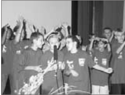
Begeistert von Westfalen: die StennerKids

sich und seine Zuhörer. Wo also fängt das Sauerland an, wo hört das Ruhrgebiet auf? Ein erstes Fazit Kluetings: Es gab und gibt weder eine klar definierte politische noch kulturelle Einheit des Sauerlandes, nur eine geographische. Und auch die hat sich seit dem späten 19. Jahrhundert im Bewußtsein der Bevölkerung mehr und mehr nach Osten verlagert. Heute ist sie mit dem Gebiet des Hochsauerlandes besetzt. Sauerland, übrigens mit sprachlichem Ursprung Sunderland (südliches Land von Soest aus gesehen), fuhr der Referent fort, hatte in den früheren Jahren eher ein negatives Image: „rückständig, beschränkt hinterwäldlerisch“. Doch aus diesem Sauerland sei ein positives Markenzeichen gerade für das Gastgewerbe geworden. Diese Chance zu nutzen, war der abschließende Appell des Referenten. Einzig der SGV decke mit seinen Aktivitäten das Gebiet des westlichen und östlichen, des Märkischen und des Kurkölnischen Sauerlandes ab. Er regte an, daß die gesamte Region mit Kulturtagen, Musikpreisen oder Wanderausstellungen an einem Strang ziehen solle.