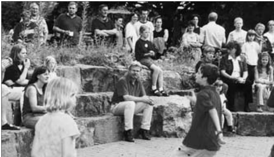
Zuschauer beim Buttertanz des Heimatvereins Lette