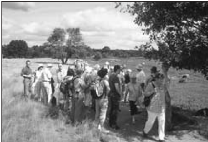
Der Schäfer stellt seine Heidschnuckenherde vor