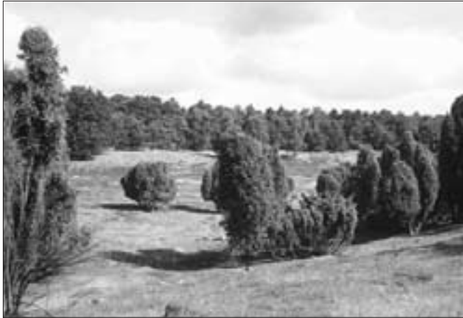
Große alte Wacholderbestände