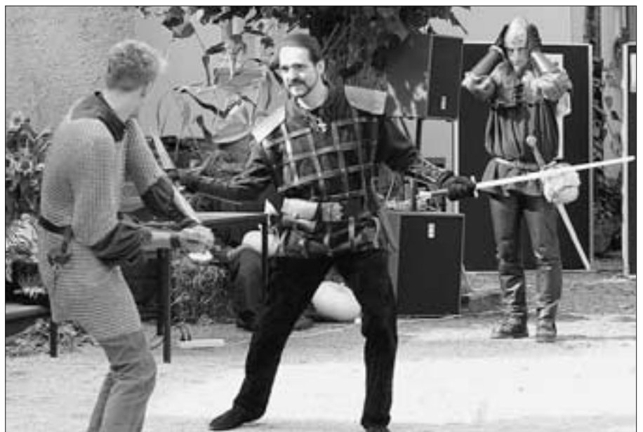
Eine Kostprobe ihres Könnens zeigten die „Ritter zu Wittkenstein“ im Hof von Haus Rhade.

Osemund“, den „Einblicken in die Kiersper Industrie“ und der Besichtigung des „Reidmeisterhauses Voswinkel“ über die Stadtführung mit dem Thema „Kirchen, Geschichte und Kunststoff“, die „Besichtigung der Jubachtalsperre und des Schleiper Hammers“ bis zur Hofbesichtigung mit Gesprächen über die heimische Landschaft“ und einer Begehung des beim Wettbewerb „Unser Dorf soll schöner werden“ mit der Goldmedaille ausgezeichneten Dörfers Rönsahl hart an der Grenze zum Bergischen Land. Es war ein