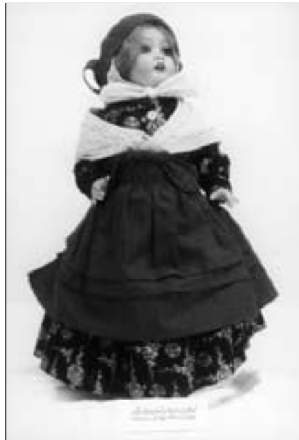
Alltagstracht aus Delbrück

Der Jungdeutsche Orden wurde 1920 von Artur Mahraun gegründet. Der Be-