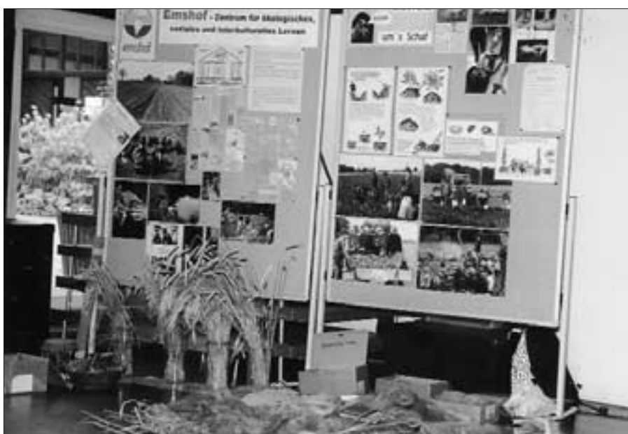
Ausstellung des Emshofes