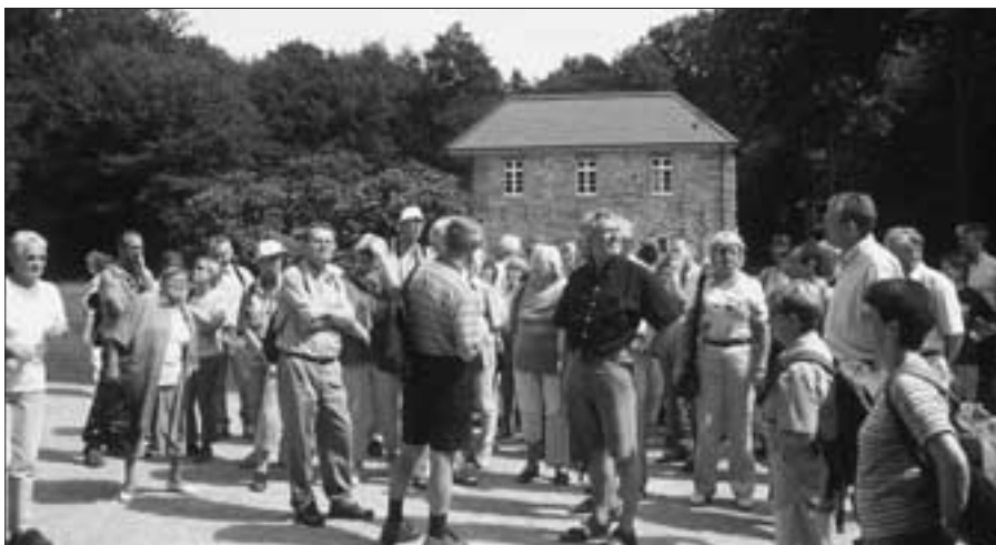
Vor dem restaurierten Kapellengebäude

In ihren Grußworten zu Beginn des Heimatgebietstages, der nach 1981 zum zweiten Mal in Beverungen stattfand,