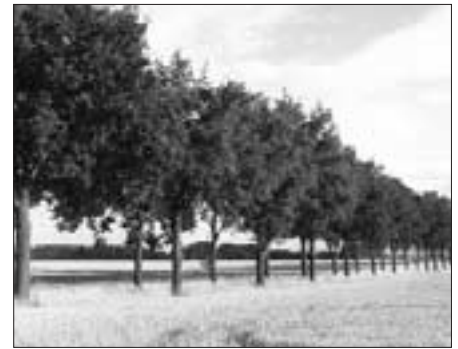
Eichenallee „Heckentruper Weg“ zwischen Diestedde und Herzfeld

Die Allee wurde erst 1959 im Zuge von Flurbereinigerungsverfahren gepflanzt und hat sich für ihr relativ junges Alter schon zu einem eindrucksvollen, das Landschaftsbild prägenden Element entwickelt. Für den Erlebniswert einer Landschaft ist Vielfältigkeit an Formen und Landschaftselementen immer positiv. Das Auge sucht unbewußt nach Strukturen, Anhaltspunkten und Orientierung in der Landschaft. An einer solchen Allee bleibt das Auge hängen und gleitet die Linie