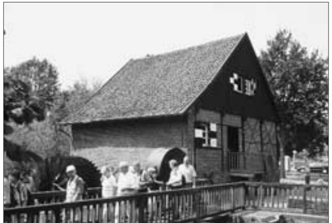
Mühle des Heimatvereins Sythen

holderbestände in Zwergstrauchheiden sind in dieser Größe und Ausprägung von hervorragender Bedeutung. Dabei stellt dieses Gebiet nur ein Relikt der damals großflächigen Ausprägung dar. Die Heideflächen sind natürlich eine rein durch den wirtschaftenden Menschen geschaffener Lebensraum. Das zur ehemaligen gemeinen Mark gehörige Gebiet wurde durch Holzeinschlag und Beweidung so stark übernutzt, bis aus einer ehemals geschlossenen Waldlandschaft eine offene Heidelandschaft entstanden ist. Neben der weiter betriebenen Schafbeweidung fand man aber noch weitere Nutzungsmöglichkeiten der Heide. „Früher wurde die Heide häufig im Zuge der sogenannten Plaggenwirtschaft abgeplaggt und als Einstreu für die Ställe verwendet“, erklärt Schröder den Zuhörern. Der mit den Fäkalien der Tiere getränkte Einstreu wurde dringend auf den Fel-